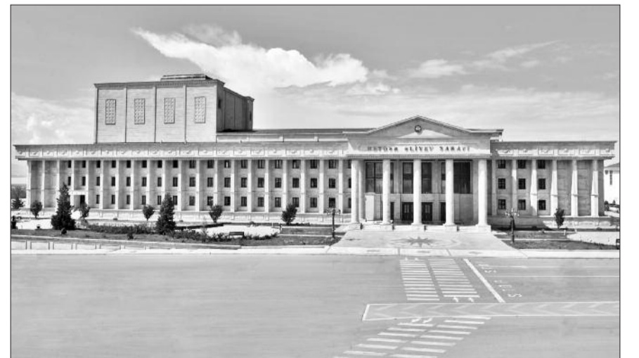
Heydər Əliyev Sarayı