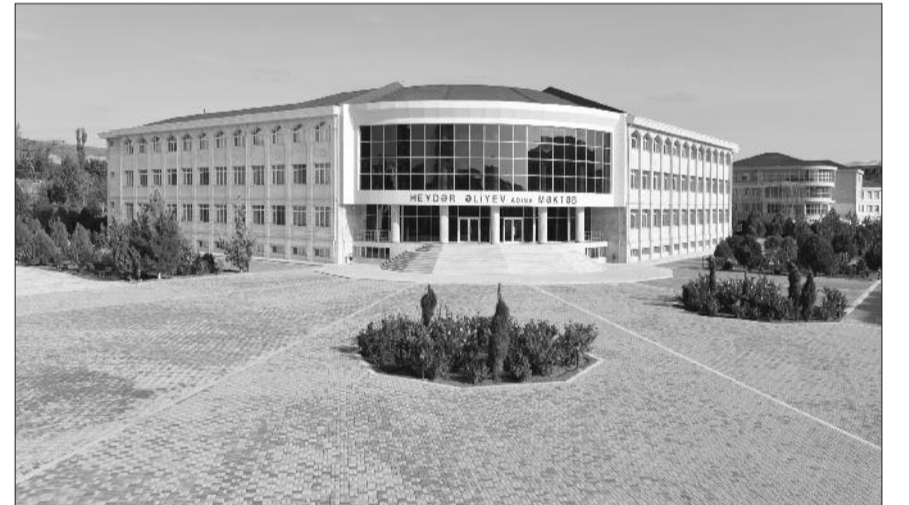
Heydər Əliyev adına tam orta məktəb