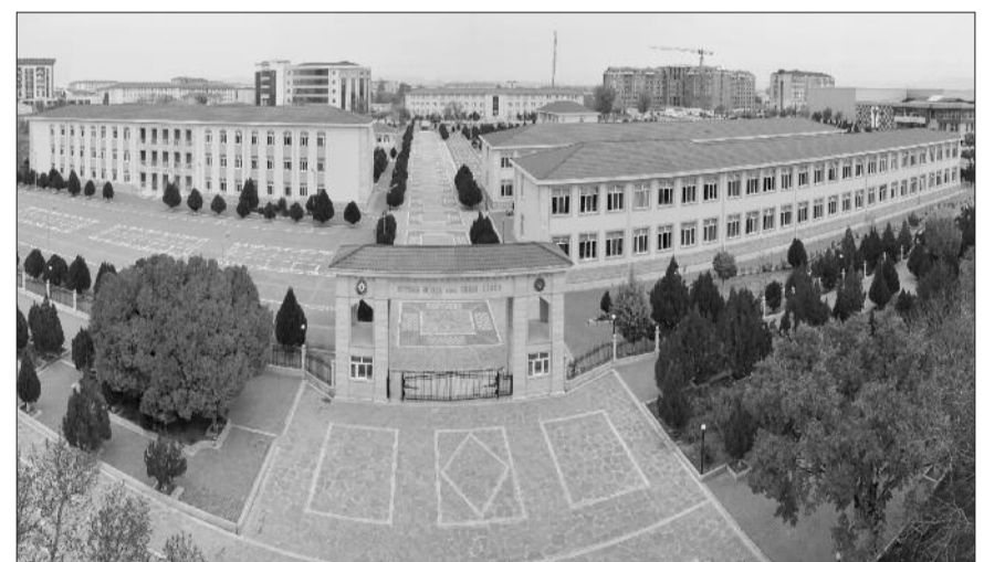
Heydər Əliyev adına Hərbi Lisey