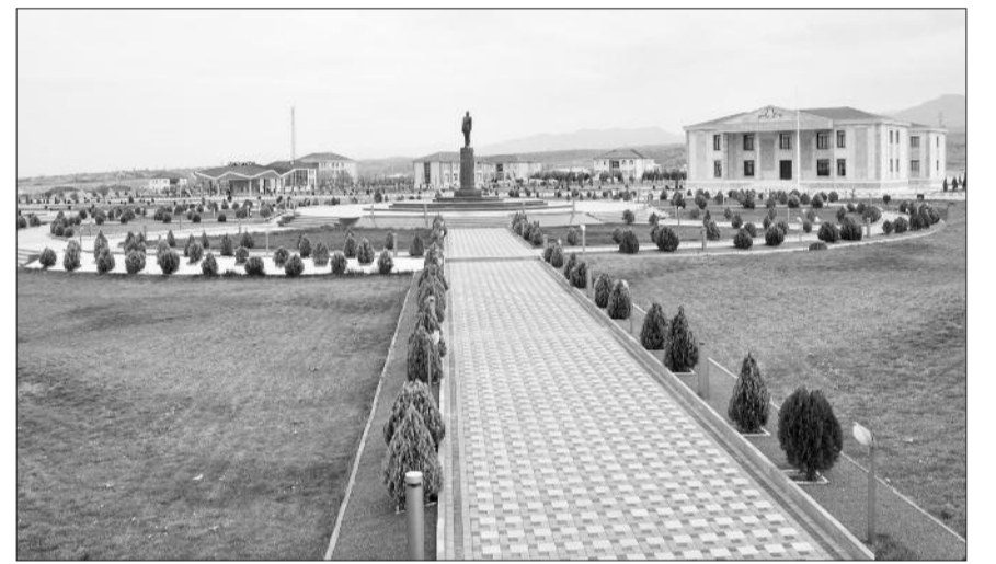
Kəngərli rayonunda Heydər Əliyev Mədəniyyət və İstirahət Parkı